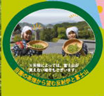
※天候によっては、富士山が 見えない場合もございます