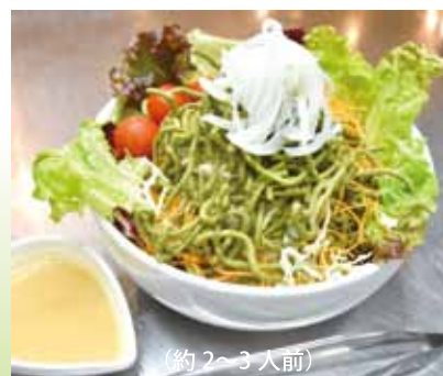
(約 2~3 人前) 蔵屋サラダ 780 円 (税込み 858 円) ●ドレッシングは 2 種類からお選びください。 ・シーザードレッシング ・自家製ドレッシング