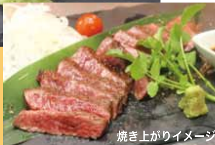
焼き上がりイメージ