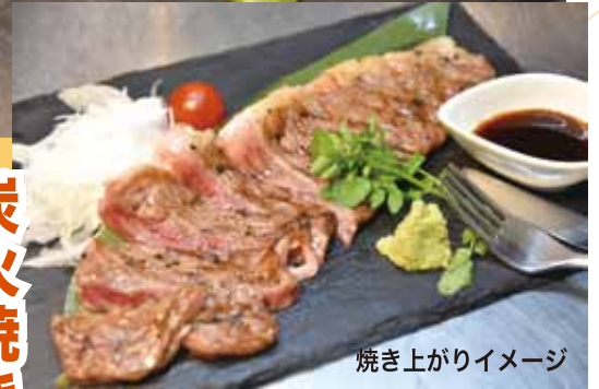
焼き上がりイメージ