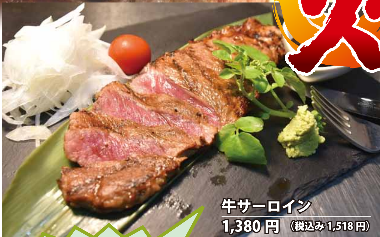
牛サーロイン 1,380 円 (税込み 1,518 円)