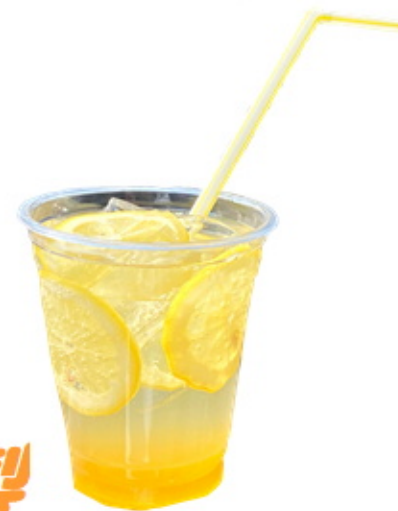
はちみつレモンソーダ